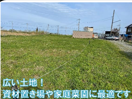
広い土地！ 資材置き場や家庭菜園に最適です